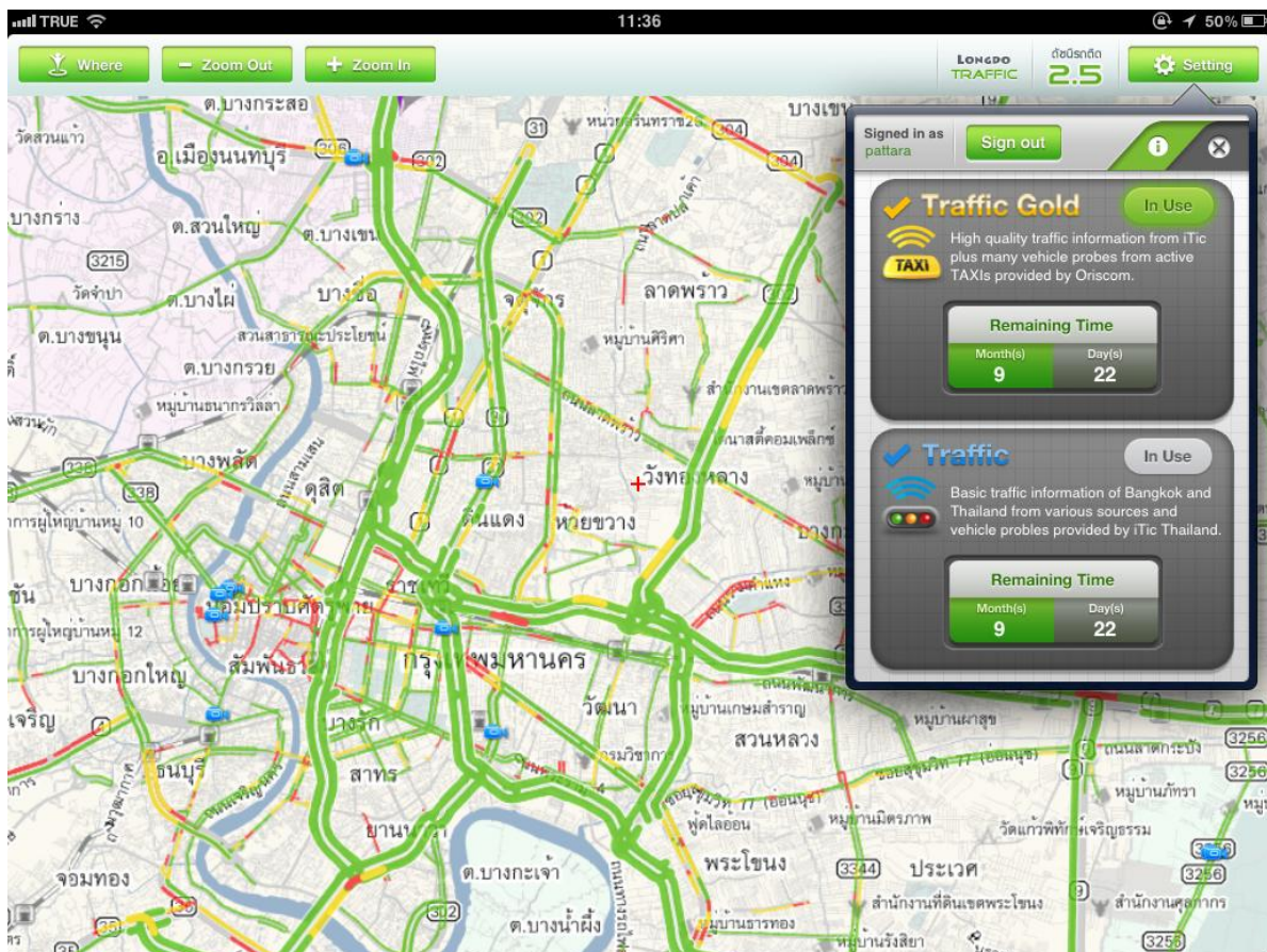
หน้าจอซอฟต์แวร์ Longdo Traffic รุ่น 2.0 สำหรับ iPad และ iPhone

ส่วนการใช้งานผ่านเว็บไซต์ http://traffic.longdo.com/ ยังคงทำได้ตามปกติ โดยจะเป็นข้อมูลสภาพจราจรแบบพื้นฐาน และไม่มีค่าใช้จ่ายบริการแต่อย่างใด